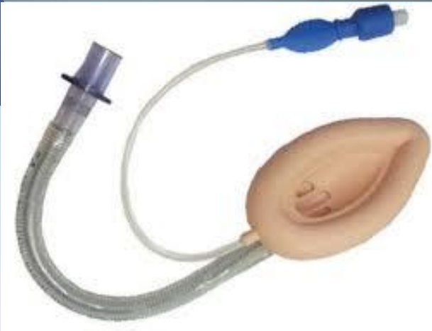
Máscara Laríngea 96.02